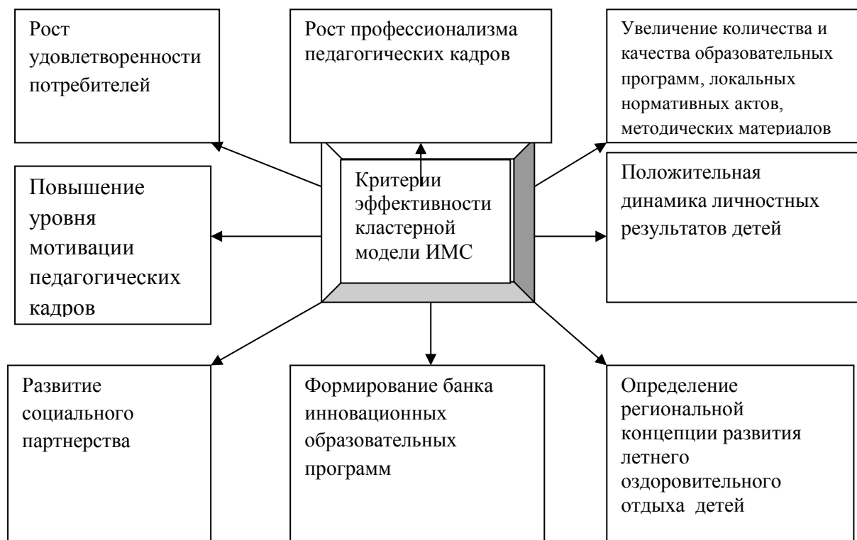
Таблица 1. Критерии эффективности кластерной модели

Критерии эффективности кластерной модели методического сопровождения региональной системы летнего оздоровительного отдыха детей определяются исходя из цели и задач.